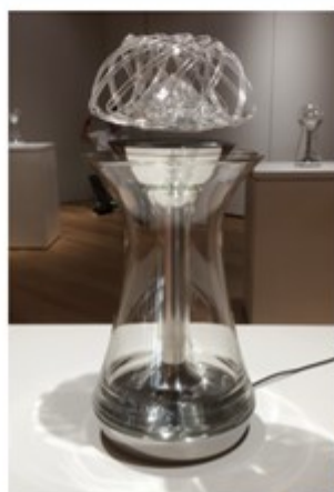
↑ 電磁浮遊を活用したカラフェ(ワインデキャンタ)