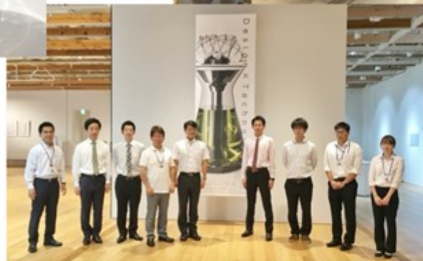
← 「芸文×工学」プロジェクト関係の皆様